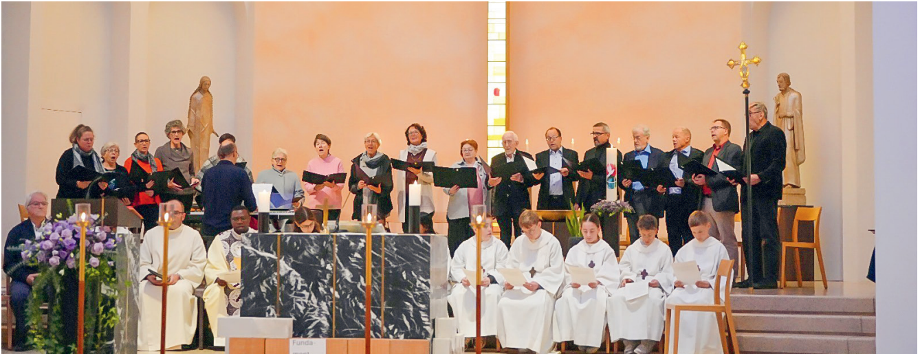
Gottesdienst vom 26. Oktober 2025