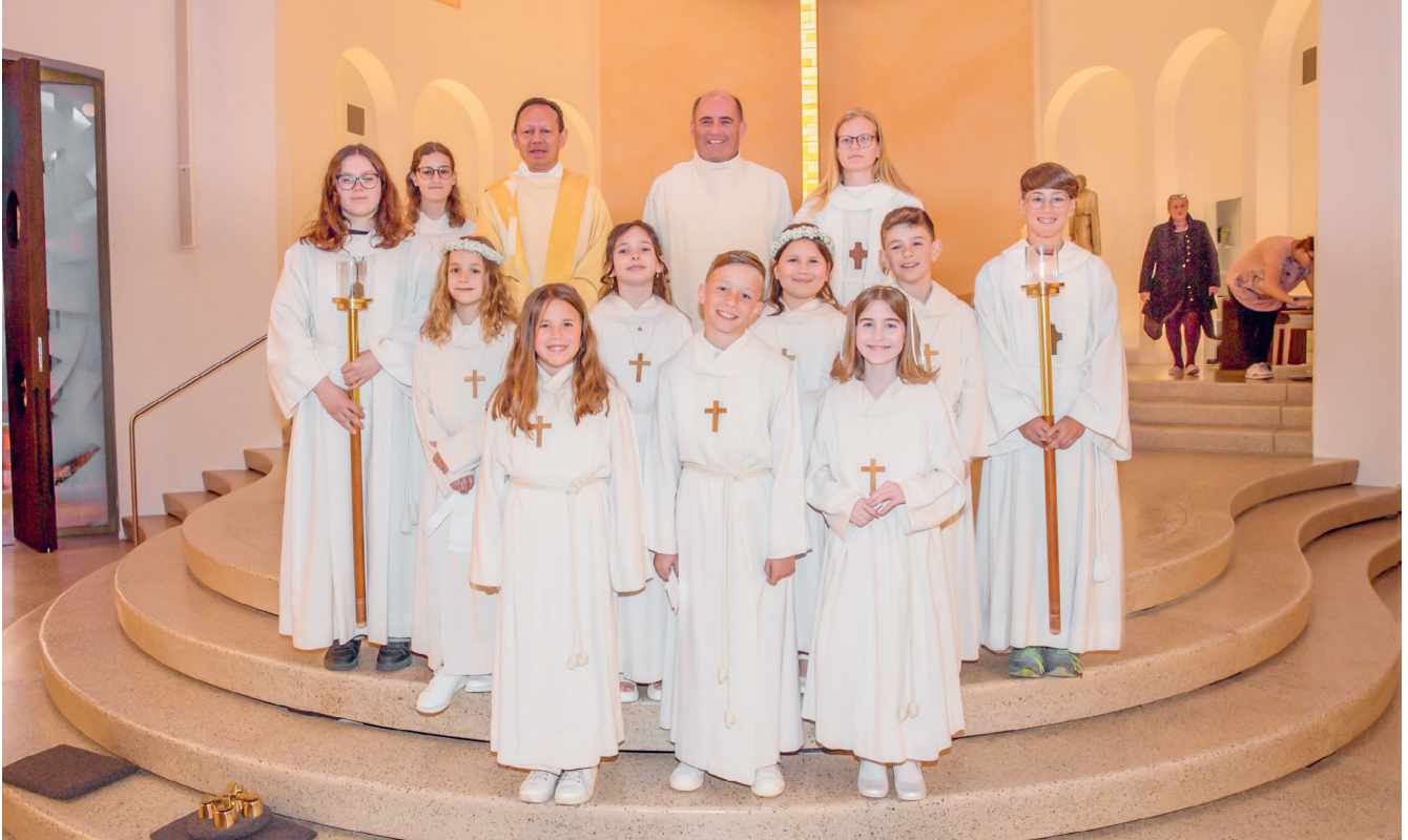
Vorgängig, auf dem Weg zur Erstkommunion, basteln die Kinder ihr Erstkommunionkreuz. Sie erneuern ihr Taufgelübde und basteln zusammen mit einer erwachsenen Begleitperson ihre Erstkommunionkerze.

Vor den Sommerferien Ende Juni organisierten wir einen Grillabend. Leider spielte uns das Wetter einen Streich, und wir mussten unter Dach grillieren und im Pfarrhaus essen. Nichtsdestotrotz war es ein toller Abend, mit vielen guten Gesprächen.