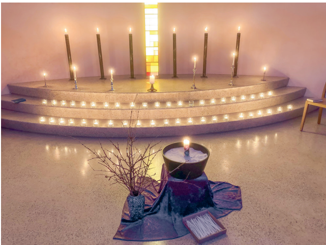
Stimmungsvoller Chorraum zu den Impulsen

Jugendlichen der Primar- und Oberstufe gestaltet. Das dritte Rorate, zusammen mit der Pfarrei Gaissau, fand 2025 erstmals in der Theresienkirche Rheineck statt. Der Kirchenchor Gaissau sang adventliche Lieder. In Zukunft wird immer abgewechselt. 2026 sind die Rorate dann in der Kirche Gaissau.